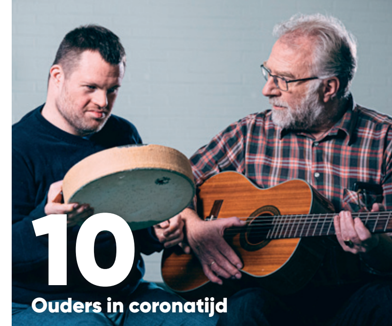
foto omslag: Late herfstzon – Expertisecentrum KJG Meppel