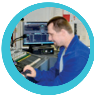
"Ik kan niet wachten tot het weer vrijdagavond is."