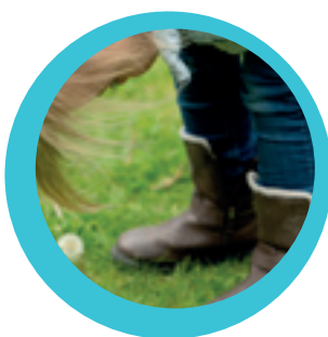
Stotteren vol overtuiging