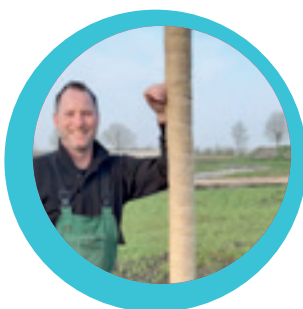
"Ik mag blij zijn dat ik bij Cosis terecht ben gekomen."