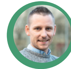
Bloggers van Cosis Zijn hoofd slaat op hol.