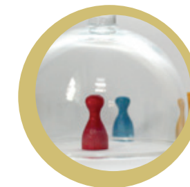
Ervaringsdeskundigen LVB over pesten