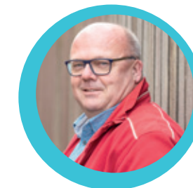
Bloggers van Cosis Een blik in de toekomst: Cosis 2025